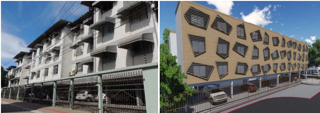
Figura 1: PRU III. Condições atuais e proposta.

Alicerçadas nas diretrizes projetuais baseadas na ferramenta, e também em outras análises realizadas (insolação, ventilação e observação in loco ), foi proposta uma intervenção no condomínio objetivando maior conforto aos usuários aproximando também o edifício aos princípios da sustentabilidade. Observando os condicionantes definidos pela legislação, foram apresentadas melhorias relacionadas à proteção solar e seleção de materiais, uso eficiente de água e energia, lazer, paisagismo, acessibilidade, melhorias do ambiente interior, entre outros. A Figura 1 mostra o PRU III atualmente e com a intervenção proposta.